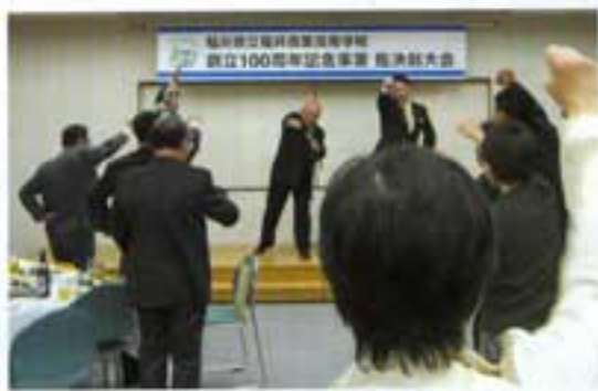
5月27日(土) FBC本社6F大ホールにて

浄財募金活動も動き始めました。これから約500日、同窓会の皆様とともに創立記念事業を大成功させるべく大いにがんばりましょう。