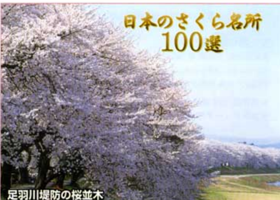
足羽川堤防の桜並木

日本さくら名所100選に選ばれた約3400本のサクラが咲き誇ります。学校の帰りに歩きませんでしたか？